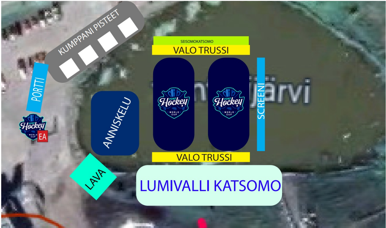
Zero Pointin tapahtuma-alue