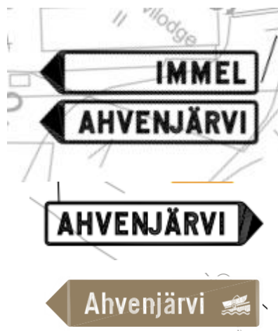
Kuva 4. Kuvaotteet paikalliskohde- sekä palvelukohteen opasteviitoista

Katu- ja tieliittymiin asennetaan väistämivelvollisuutta osoittavat kärkikolmiot lukuun ottamatta Ahvenmutkan Ahvenperä, Ahvenpisto, Ahvenpätkä katuja sekä Tuomaanniementien Tuomaankuja ja Tuomaanpisto-katuja, jotka ovat tasa-arvoisia (väistämivelvollisuus oikealta tulevia kohtaan).