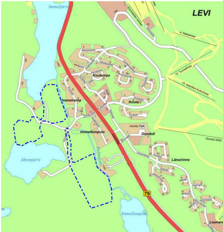
Kuva 1. Suunnitteluala opaskartalla

Suunnittelualan liikenne tukeutuu alueelle johtavaan asfalttipintaiseen Tuomikuruntie- katuun. Alueella on nykyisin voimassa 40 km/h aluenopeusrajoitus. Alueella ei ole katuvalaistusta. Alueella sijaitsee ulkoilureittejä sekä moottorikelkkareitti.