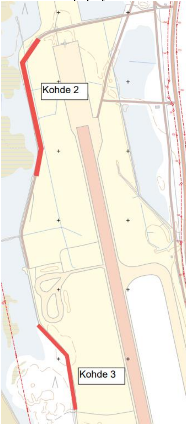
Kartta 2. Lentokentän pohjoisosan hyötykäyttökohteet 2 ja 3.